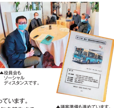
役員会もソーシャルディスタンスです。